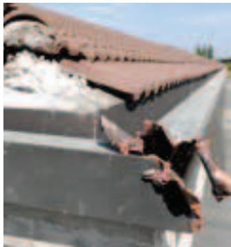
Danni causati dai ladri a un composanto

■ Continua la linea dura del tribunale di Lodi nei confronti dei ladri di rame: ieri mattina sono stati mandati subito in carcere, con una pena di un anno, e 300 euro di multa, senza sospensione condizionale, i tre romeni che erano stati arrestati in flagranza di reato nella notte tra il 30 e il 31 agosto scorso dai carabinieri di